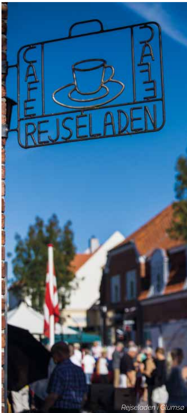
Rejseladen i Glumsø